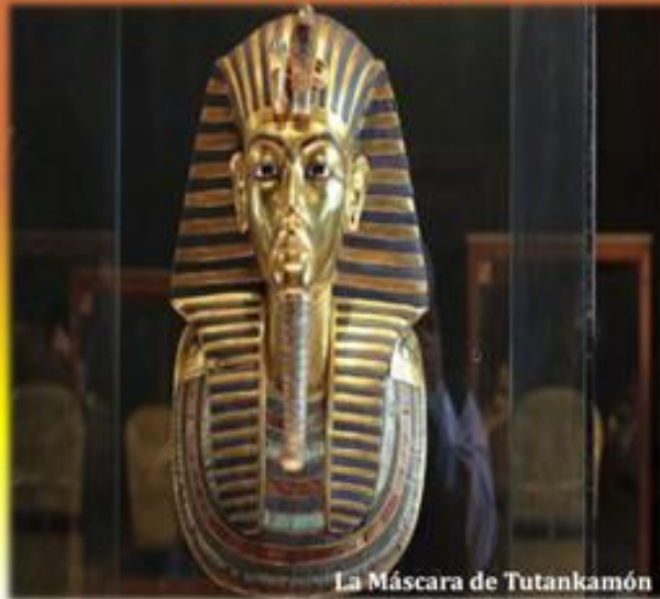
La Máscara de Tutankamón